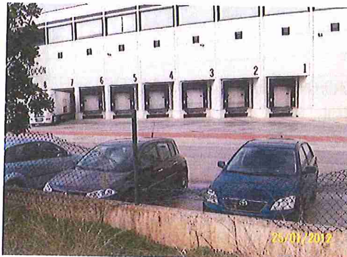
Lateral derecho del ecoparque

El vallado correspondiente a los laterales y parte trasera del ecoparque, se encuentra muy deteriorado y con tramos inexistentes.