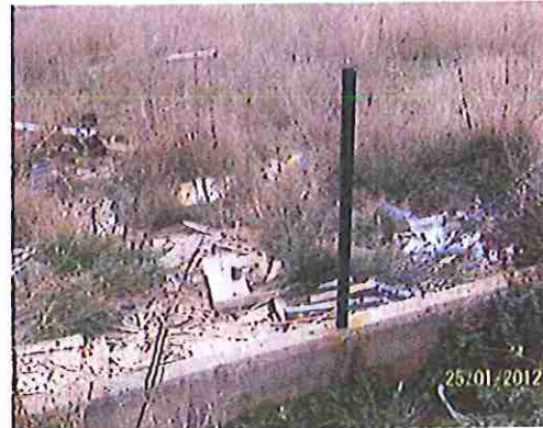
Lateral izquierdo del eco-parque